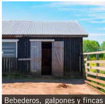
Bebedores, galpones y fincas